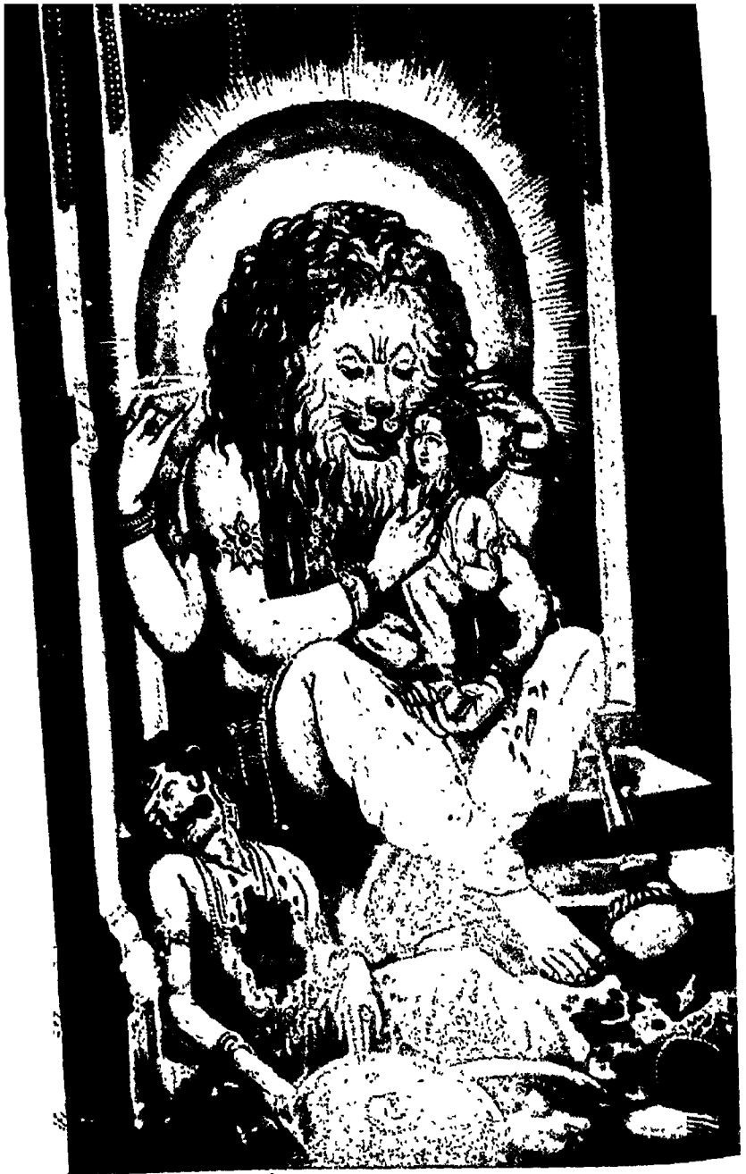
भगवान् नृसिंहकी गोदमें भक्त-प्रह्लाद